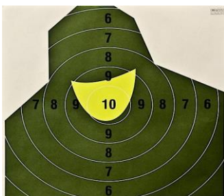
Pistolet centralnego zapłonu 20 strz. TARCZA NT 23